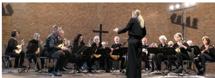
Mandolinen-Orchester Rurtal 1928 Koslar e.V.

Nun wurde es ernst. Drei Orchester aus dem BDZ-NRW hatten sich auf den Weg nach Bochum gemacht, um am 40. Landes-Orchesterwettbewerb des Landesmusikrates teilzunehmen. Die Christuskirche im Zentrum der Stadt ist ein hervorragender Austragungsort mit einer guten Akustik und guten Möglichkeiten für die Orchester, sich in ausreichender Zeit einspielen zu können.