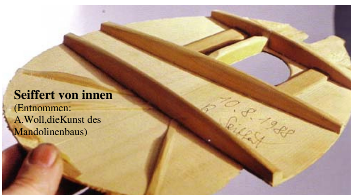
Seiffert von innen

Zu verkaufen: Mandola Klaus Knorr Palisander, Baujahr 1994 mit Koffer und Kofferhülle, in gutem Zustand. Tel. 003146 4339903 annemie.hermans@planet.nl ,