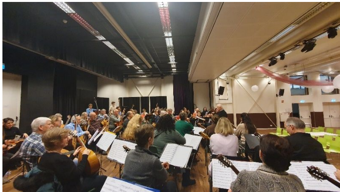
Festivalorchester bei der Probe

"Ballade I für Zupforchester" (niederländische Uraufführung), der wundervollen "Spring Fantasy" (Uraufführung) von Marlo Strauß wusste Dieter Kreidler dem Publikum einen sinfonischen Klang seinesgleichen zu präsentieren. Mit der weiteren eigenen Uraufführung von "Just for Fun" für Zupforchester und Tuba (verfügbar war kurzfristig allerdings nur eine Bassposaune, die einer Tuba aber in nichts nachstand) übergab Dieter Kreidler das Jahr der Mandoline 2023 elegant an das Jahr der Tuba 2024.