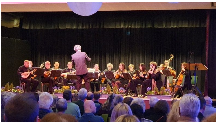
Cercle Royal des Mandolinistes de Malmedy

Das "Mandolinen-Orchester Rurtal 1928 Koslar" eröffnete das Festival mit der "Sonata Nr. VI a Grand Orchestre" von Valentin Roeser, gefolgt von dem ausdrucksstarken, farbenreichen und rhythmusstarken ersten Satz "Allegro ostinato" aus "Topas" von Marlo Strauß und lud mit "Short trip to Greece" von Dieter Kreidler gefühlt zum Tanzen eines Walzers und eines Sirtaki ein.