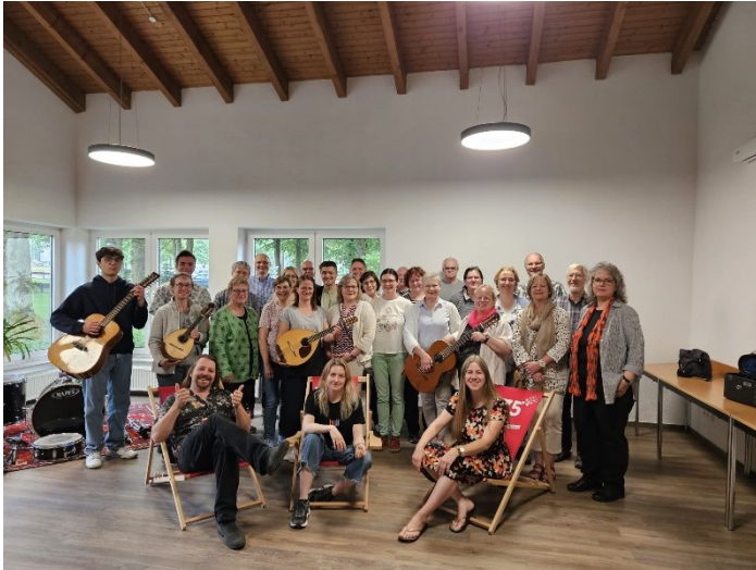
Teilnehmer des Forums NRW mit den Dozenten (Red.)

https://bundemusikverband.de/wp-content/uploads/2023/04/Ausschreibung_Musik-fuer-alle.pdf